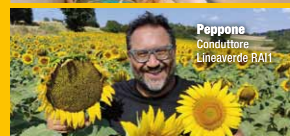
Peppone Conduttore Lineaverde RAI1